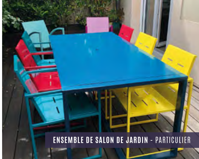
ENSEMBLE DE SALON DE JARDIN - PARTICULIER

Nos salles de classe sont entièrement équipées de TV, vidéoprojecteur et l'école possède une salle informatique. L'Iron Academy dispose également d'une salle de restauration à disposition des élèves et d'une salle de repos.