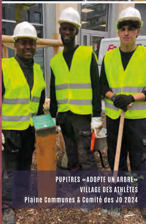
PUPITRES « ADOPTE UN ARBRE » VILLAGE DES ATHLÈTES Plaine Communes & Comité des JO 2024