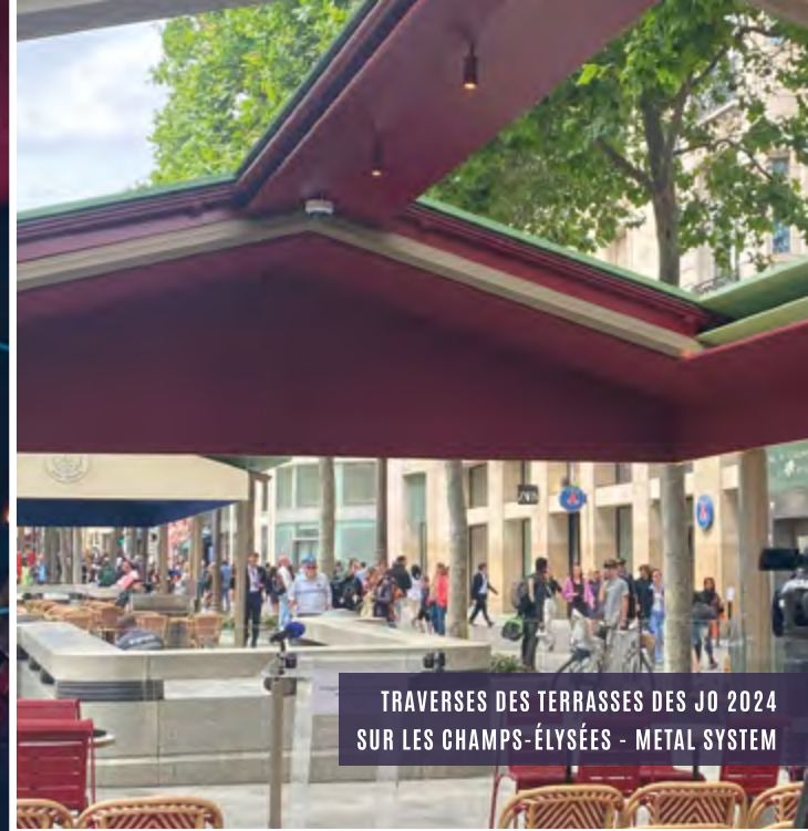
TRAVERSES DES TERRASSES DES JO 2024 SUR LES CHAMPS-ÉLYSÉES - METAL SYSTEM