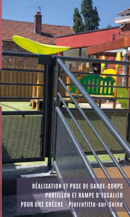
RÉALISATION ET POSE DE GARDE-CORPS PORTILLON ET RAMPE D'ESCALIER POUR UNE CRÈCHE - Pierrefitte-sur-Seine

En nous faisant confiance, vous prenez part à cette aventure humaine qui nous motive à chaque instant et contribuez à la réussite professionnelle et personnelle de ces jeunes.